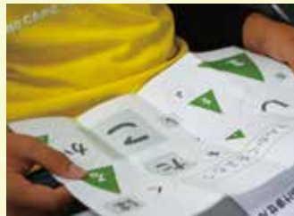
暗号をとけるかな