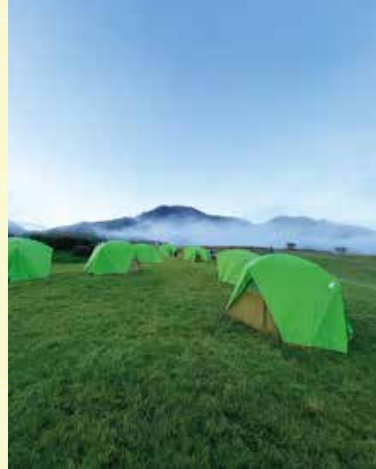
大自然の中のテント泊