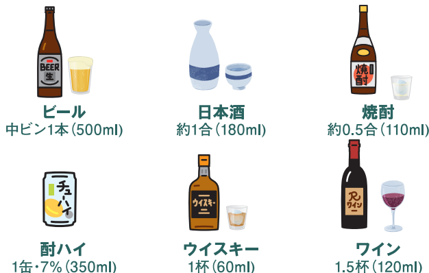
図1 節度ある適度な飲酒(純アルコール20g) 女性・高齢者・お酒に弱い体質の人は半分

記録(飲酒日記)につけることが有効とされています。記録というと面倒に感じられるかもしれませんが、達成できたかどうかを○△×で評価する程度でも構いません。最近は、簡単に入力できるアプリも多数開発されていますので、一度使ってみてはいかがでしょうか。