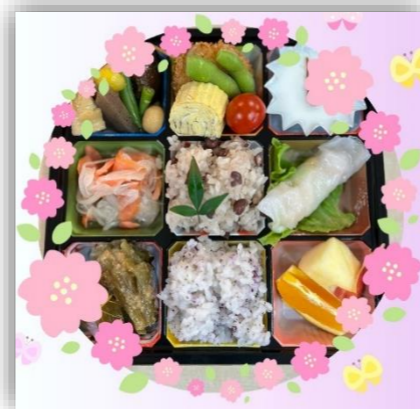
肥後銀行作品展示

3/28のかんたんクックでは「お花見弁当」を作りました。かんたんクックとは言え、かなり前からメニューを考え、前日から野菜をカットする等準備をして作りました。お弁当を持ってお花見に行く予定でしたがあいにく雨でした。実際のお花見はできませんでしたが想像の桜に心躍らせ、活動室で美味しくいただきました。